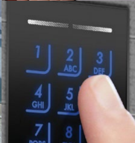
Ekey fingerprint access systems Συστήματα πρόσβασης με αναγνώρισης δακτυλικών αποτυπωμάτων